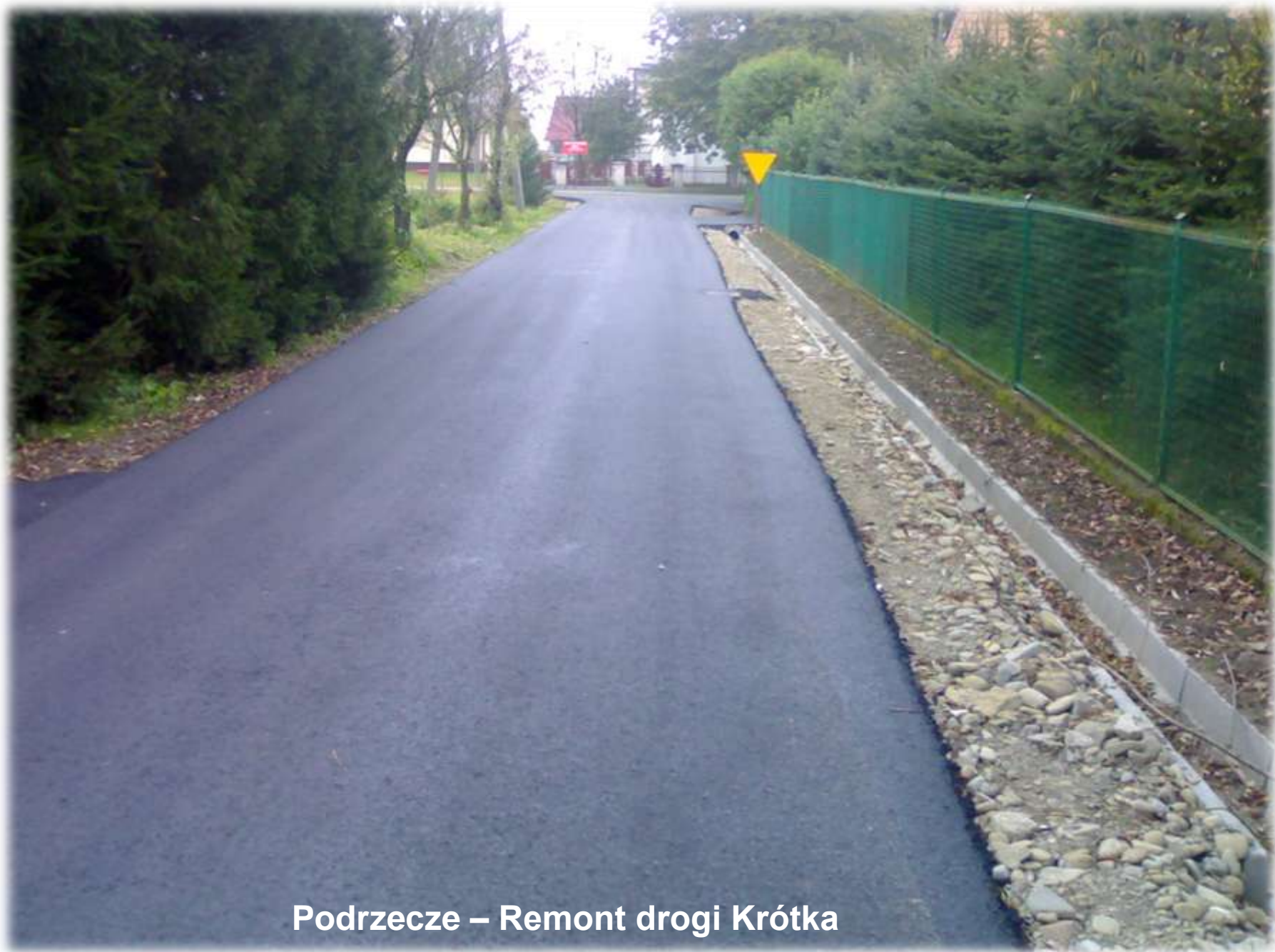
Podrzedze – Remont drogi Krótka