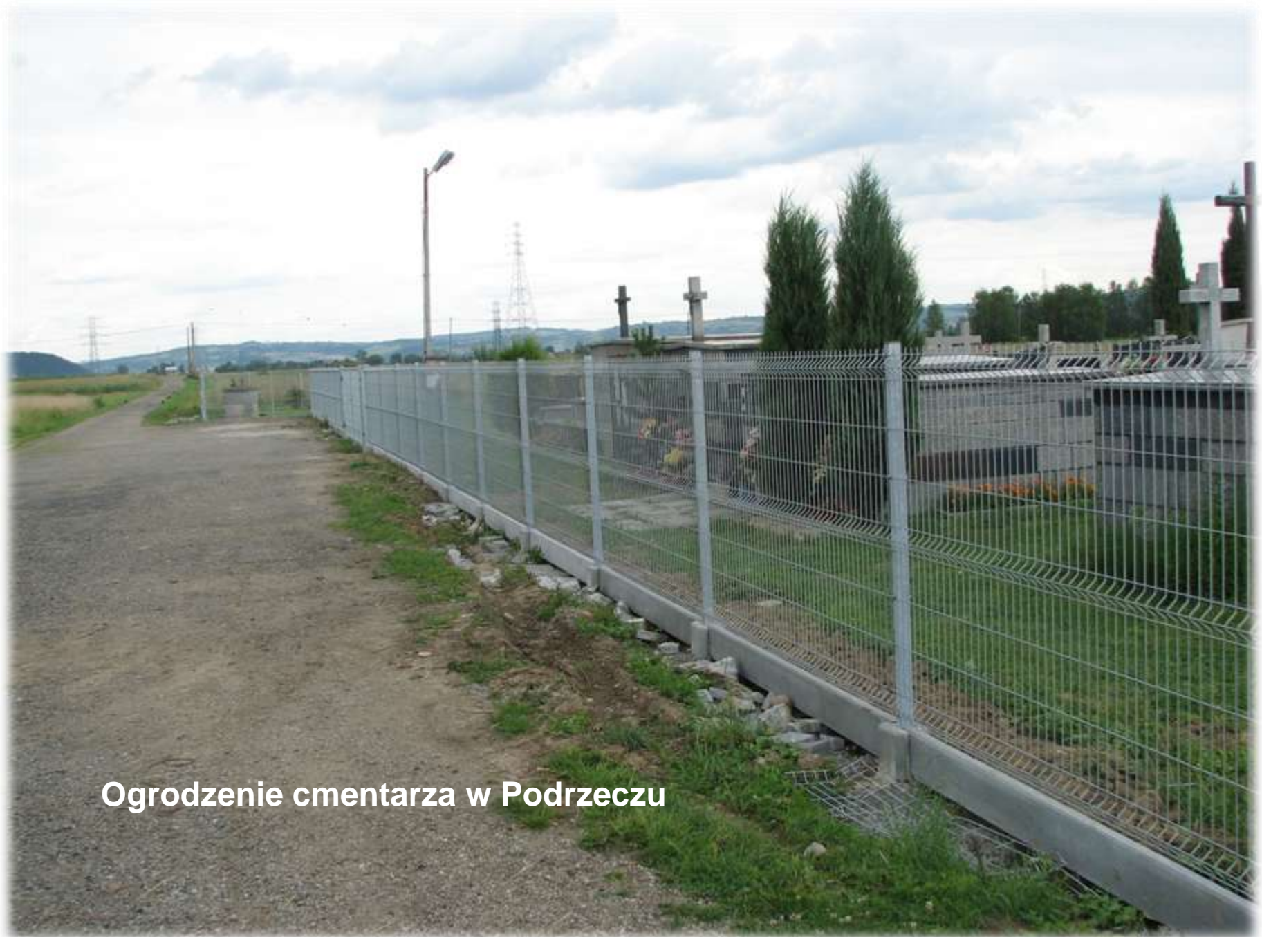
Ogrodzenie cmentarza w Podrzeczu