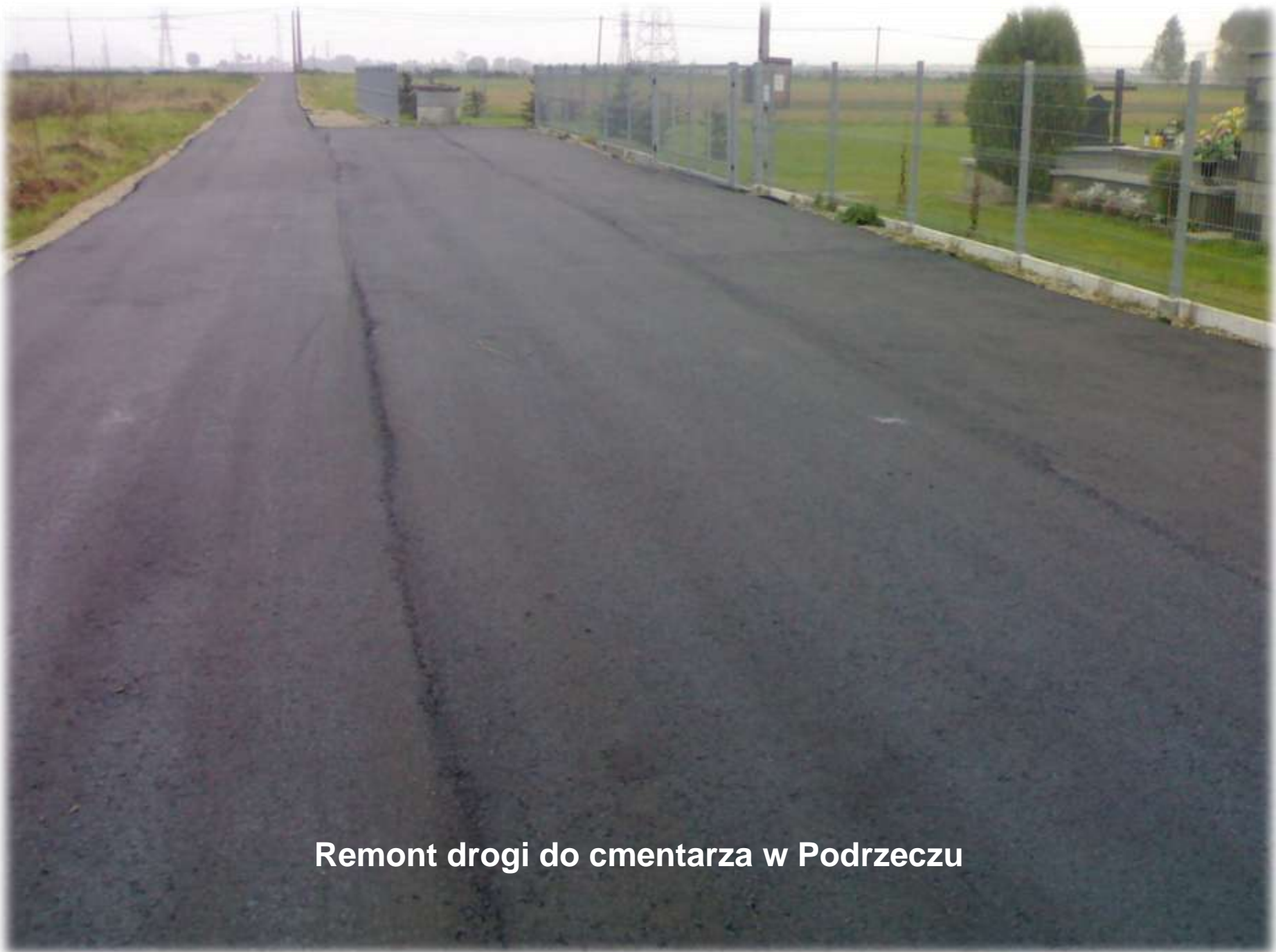
Remont drogi do cmentarza w Podrzeczu