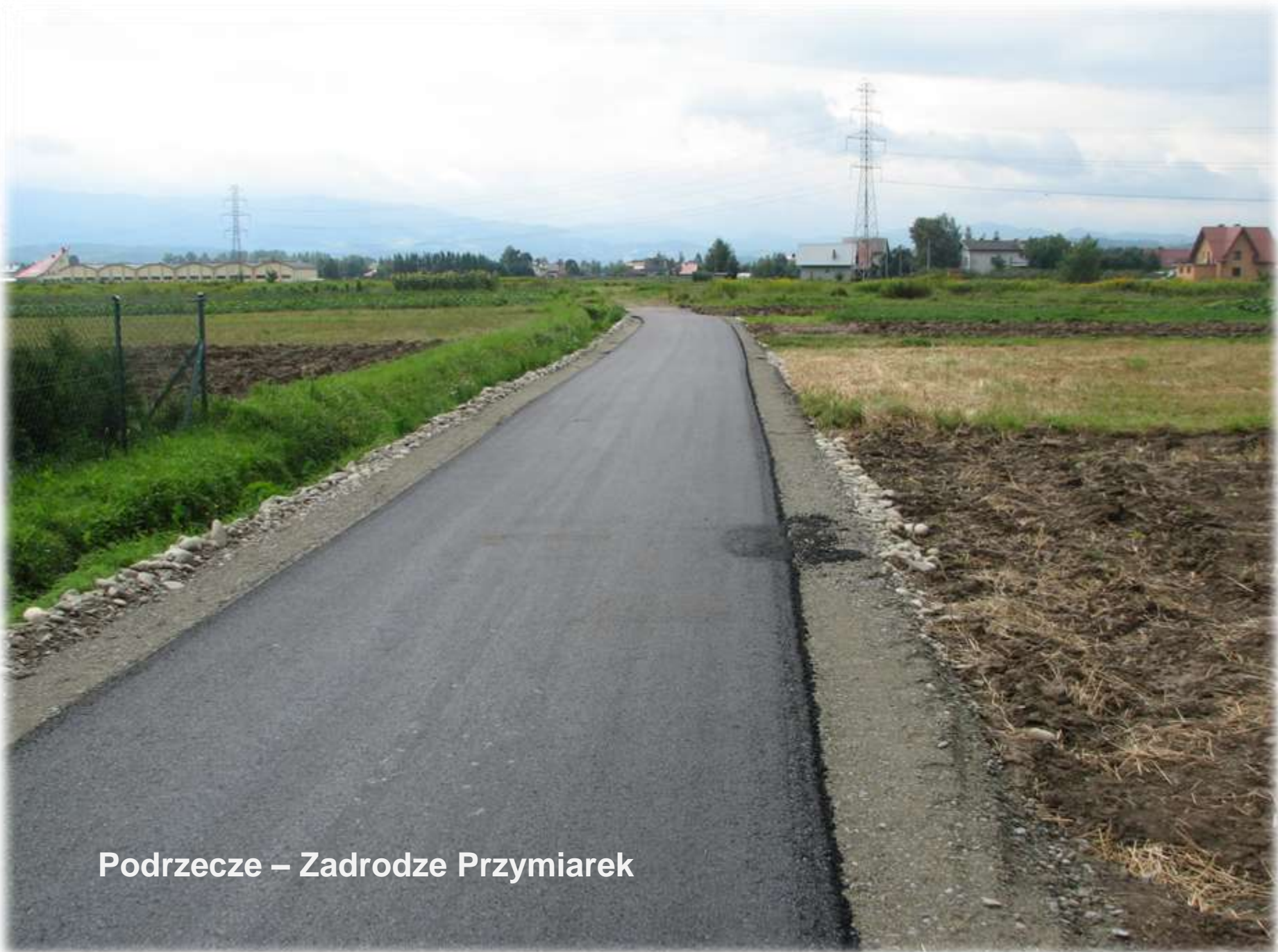
Podrzecze – Zadrodze Przymiarek