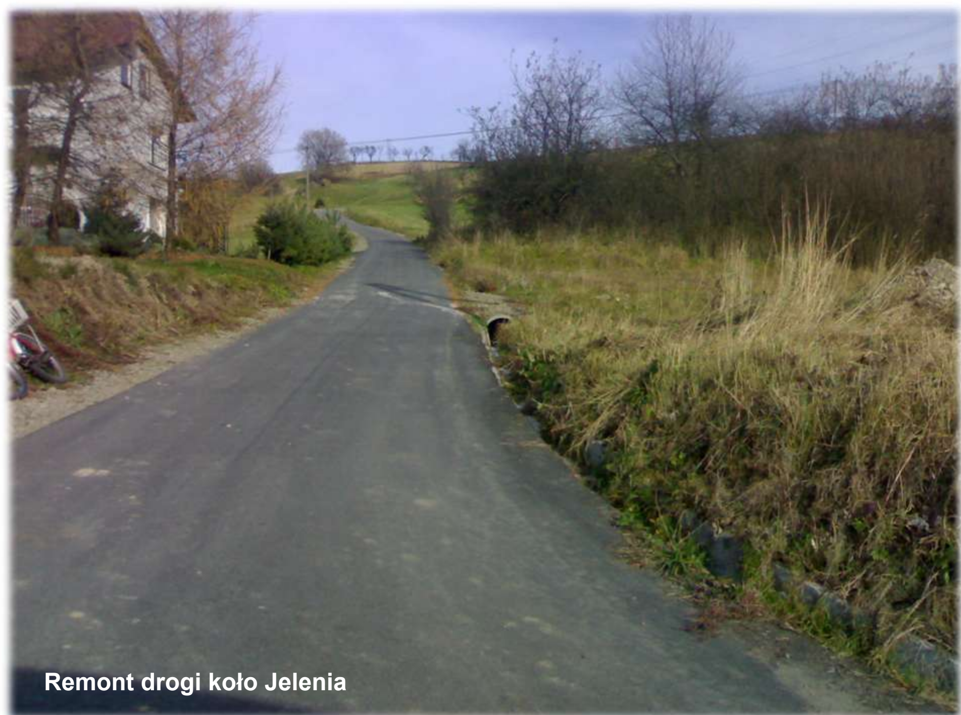
Remont drogi koło Jelenia