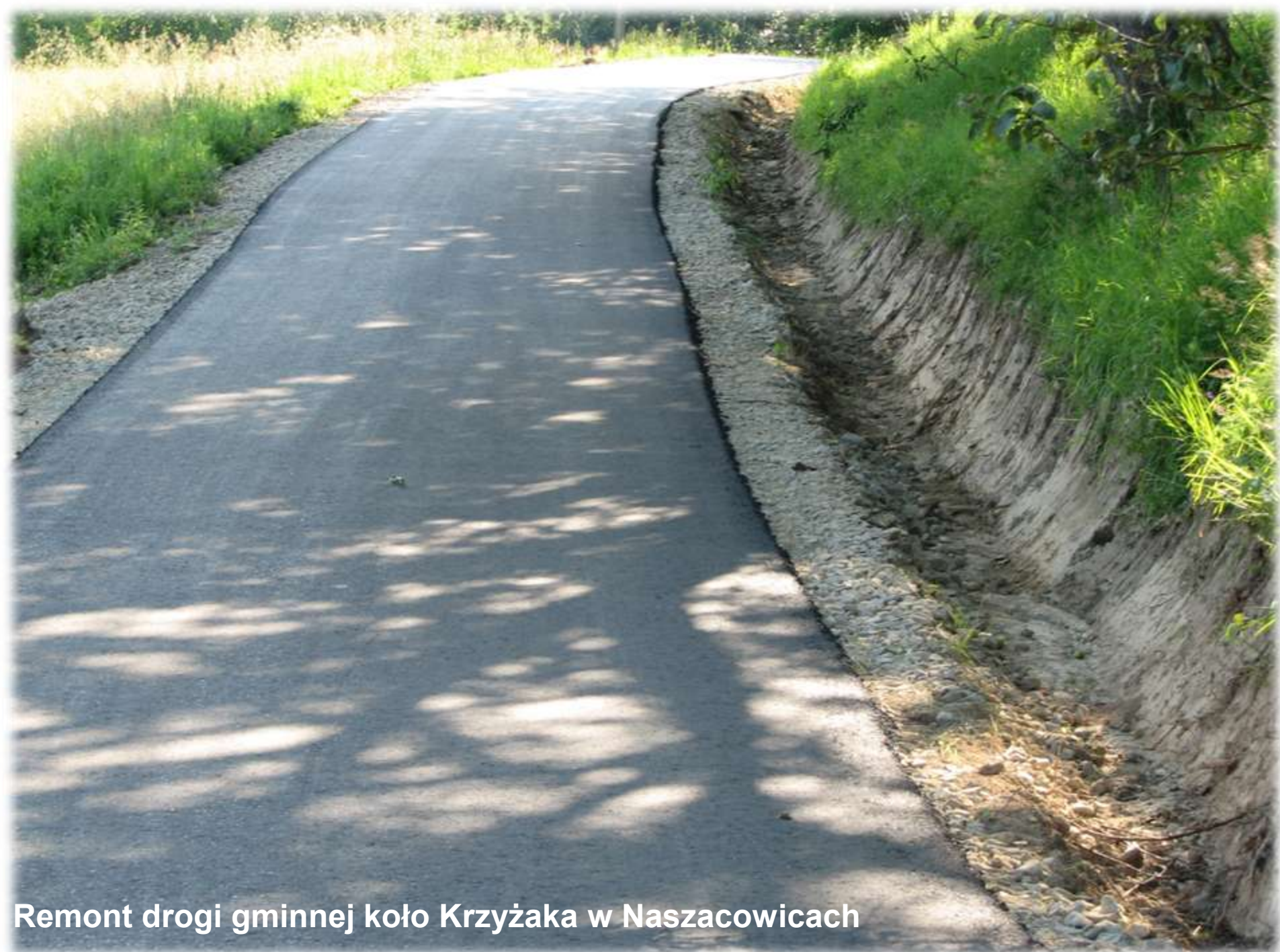
Remont drogi gminnej koło Krzyżaka w Naszacowicach