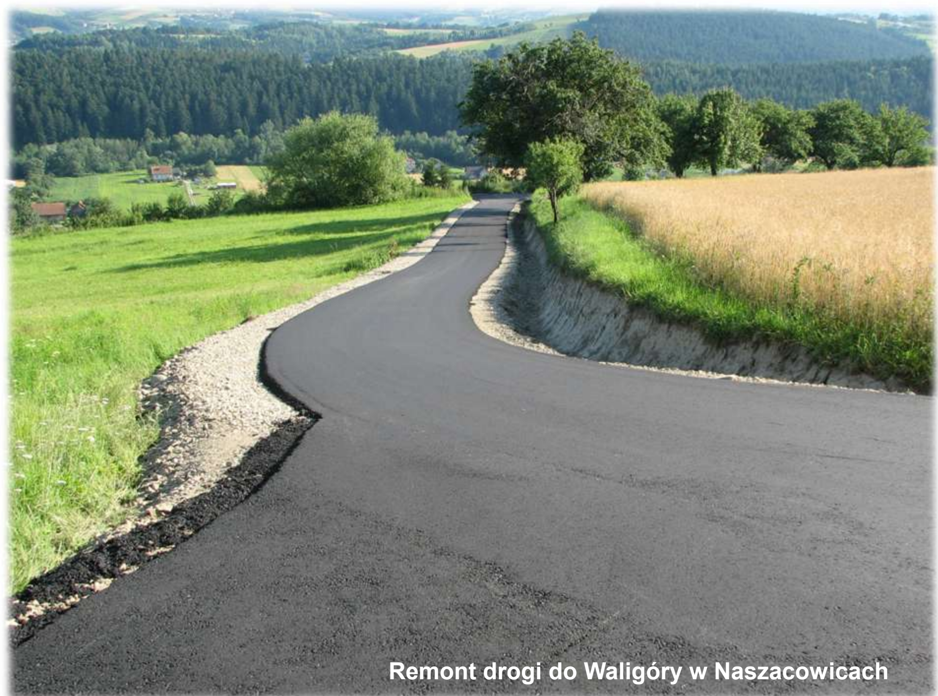
Remont drogi do Waligóry w Naszacowicach