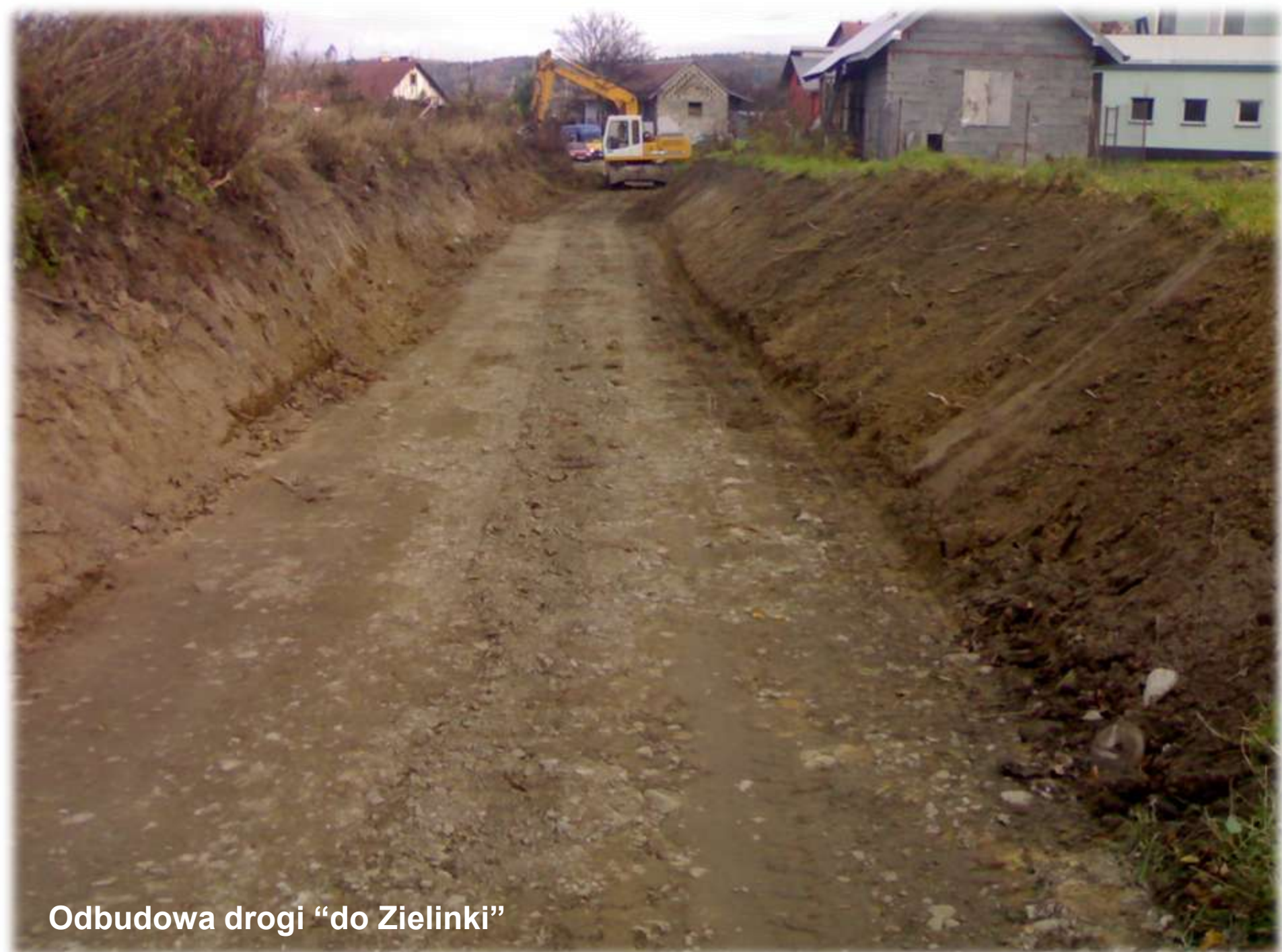
Odbudowa drogi "do Zielinki"