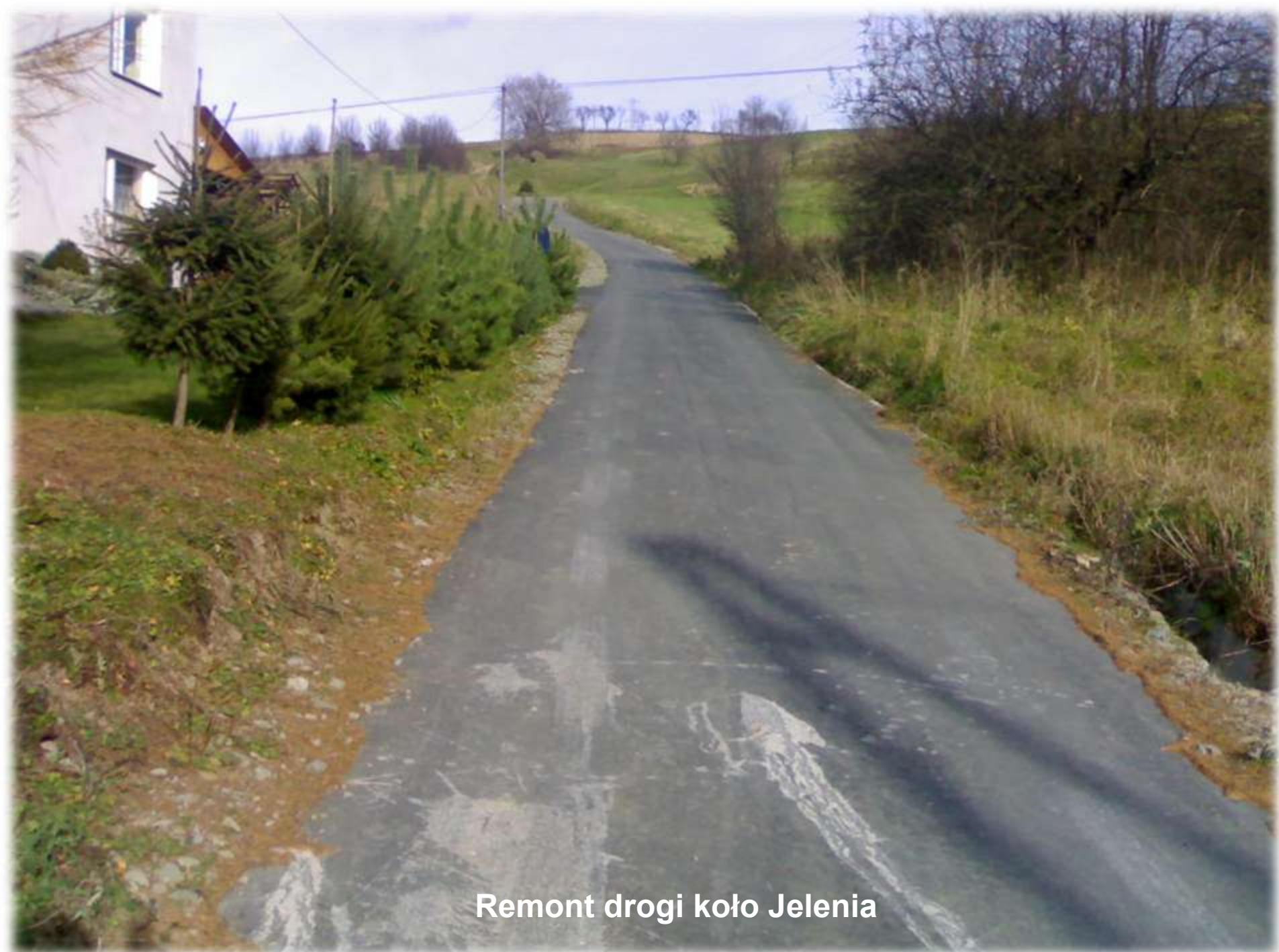
Remont drogi koło Jelenia