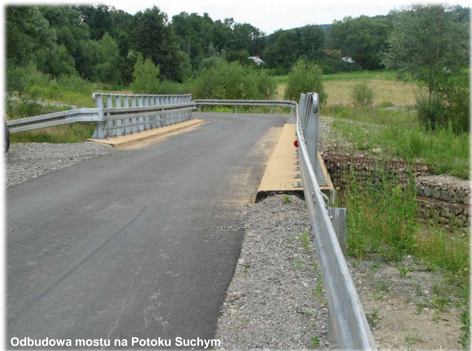
Odbudowa mostu na Potoku Suchym