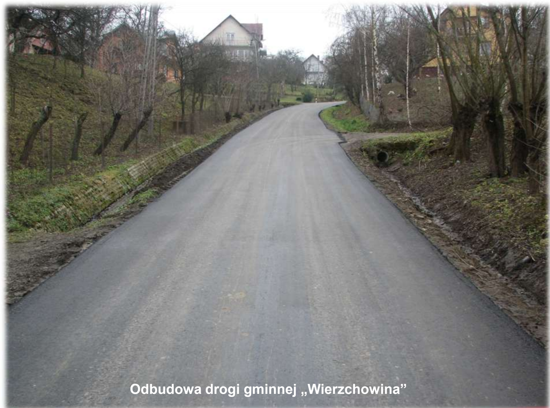
Odbudowa drogi gminnej „Wierzchowina”