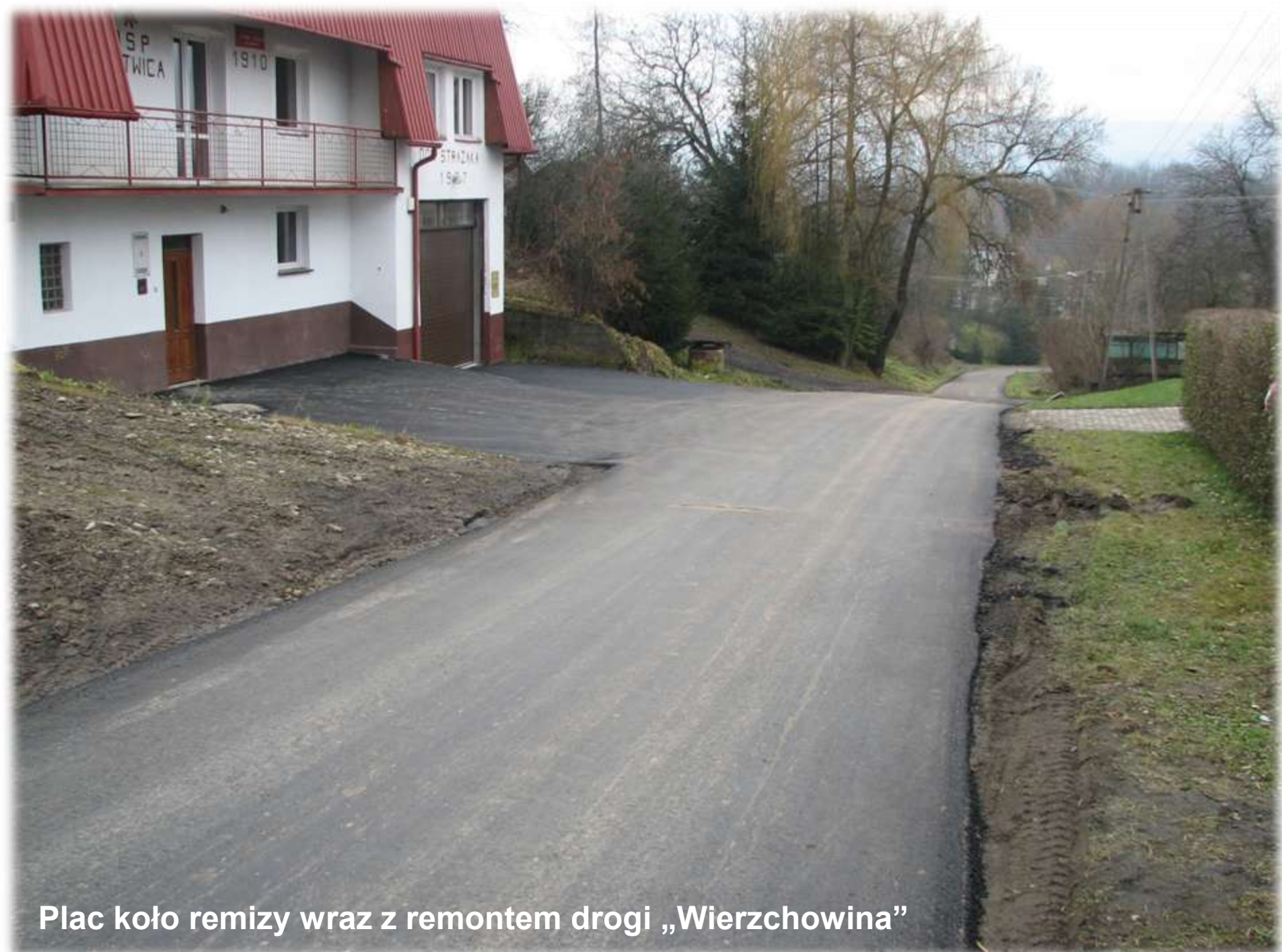
Plac koło remizy wraz z remontem drogi „Wierzchowina”