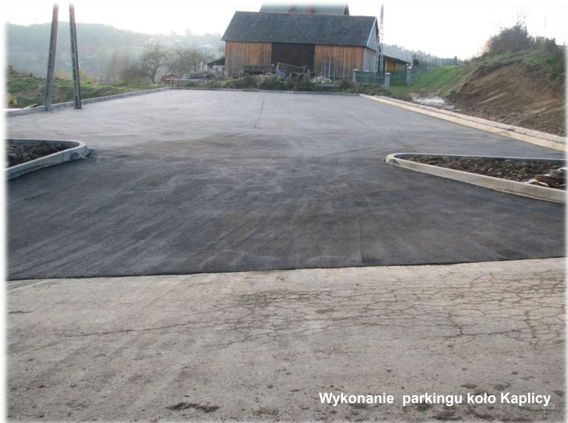
Wykonanie parkingu koło Kaplicy