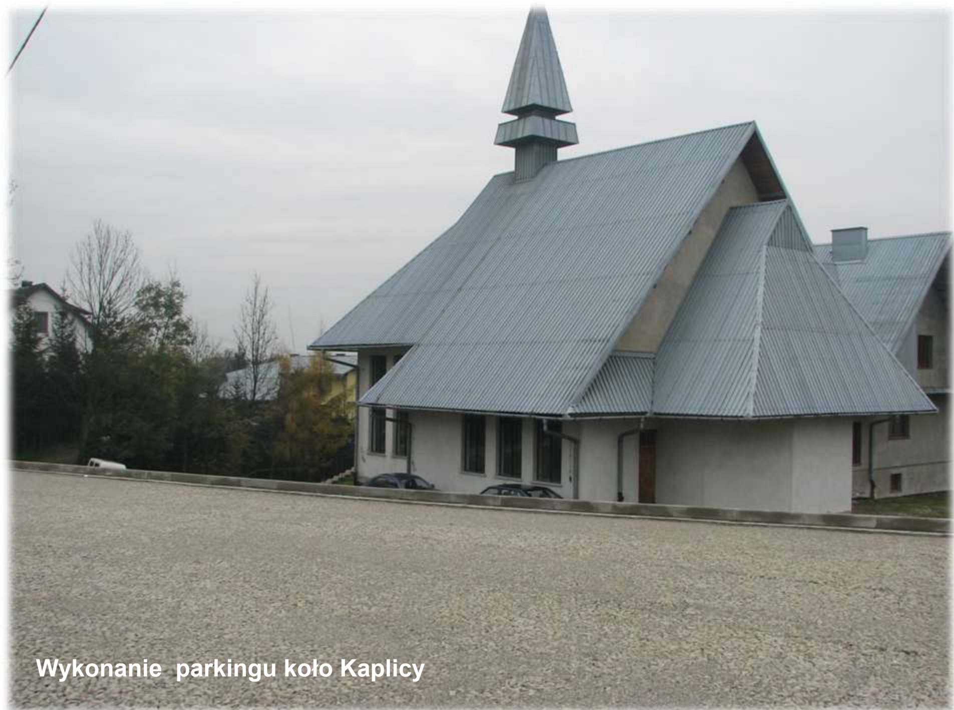
Wykonanie parkingu koło Kaplicy