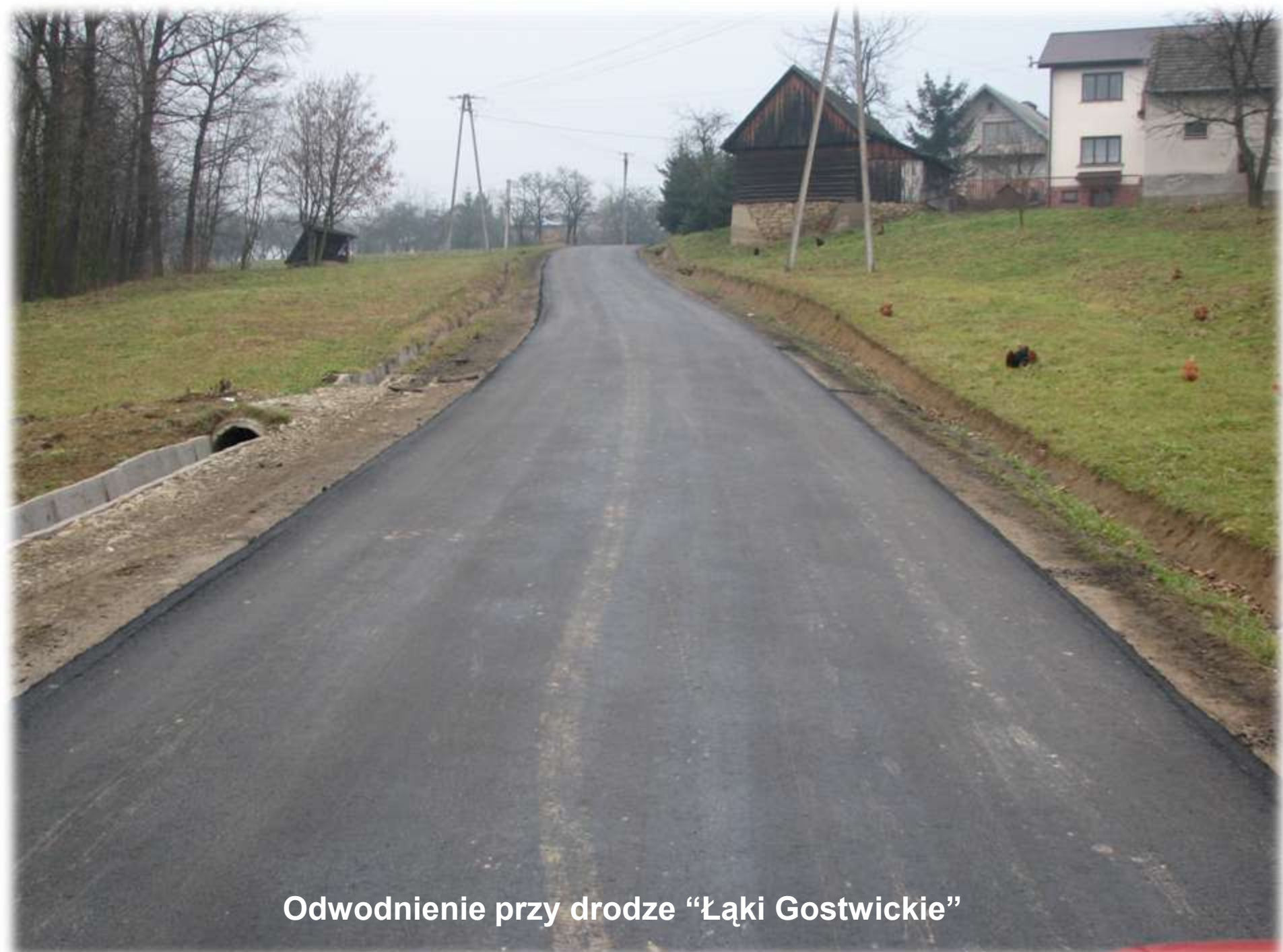
Odwodnienie przy drodze “Łąki Gostwickie”