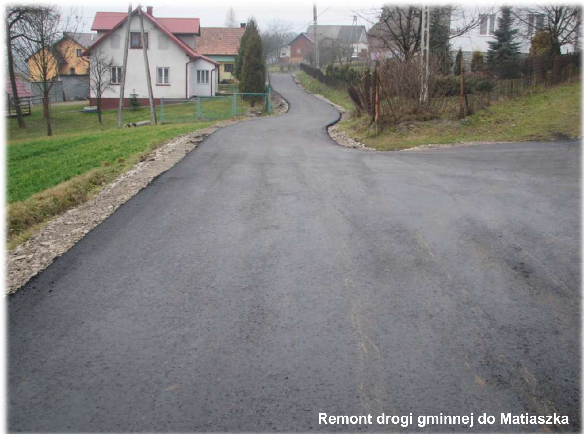
Remont drogi gminnej do Matiaszka