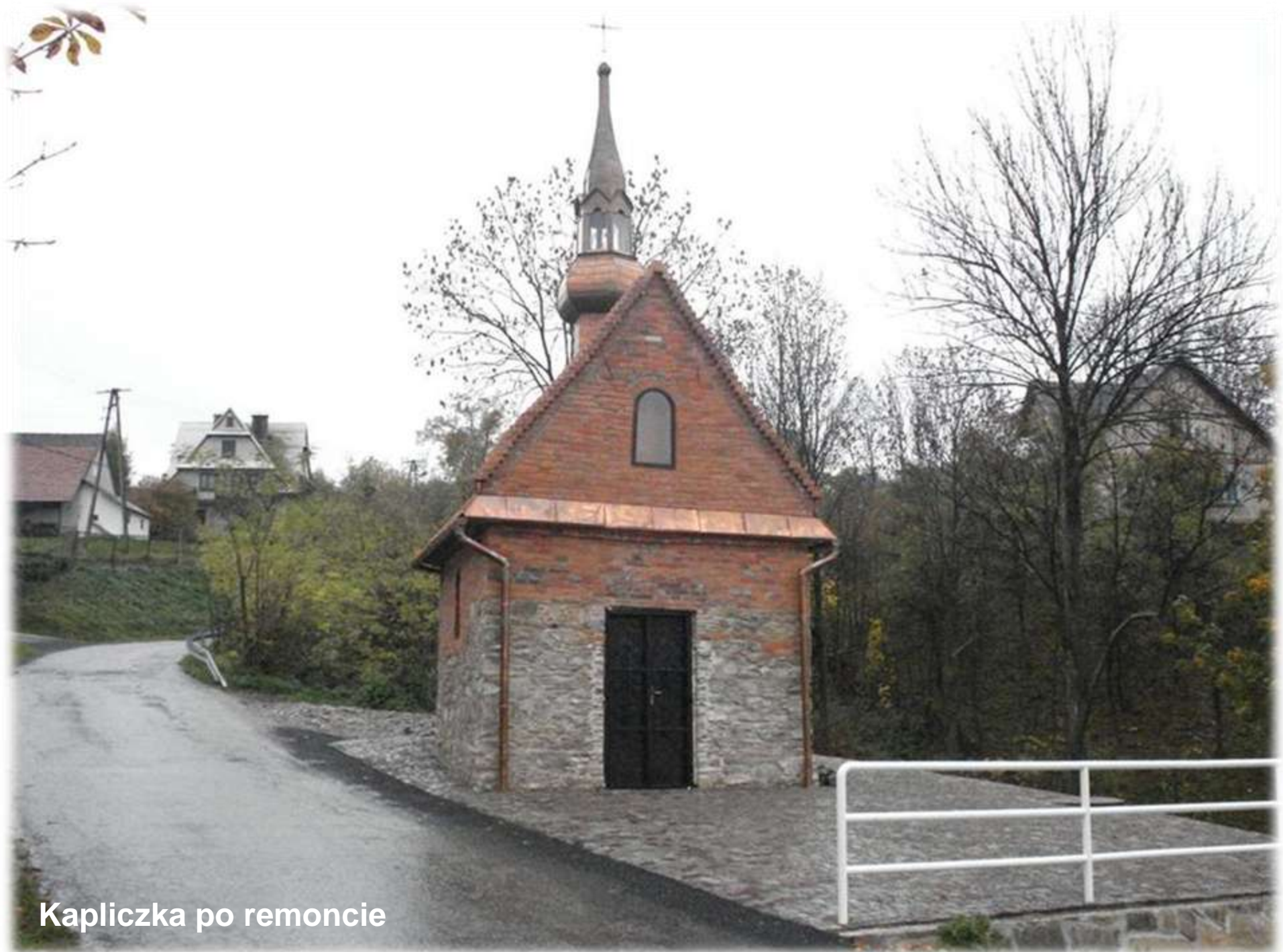
Kapliczka po remoncie