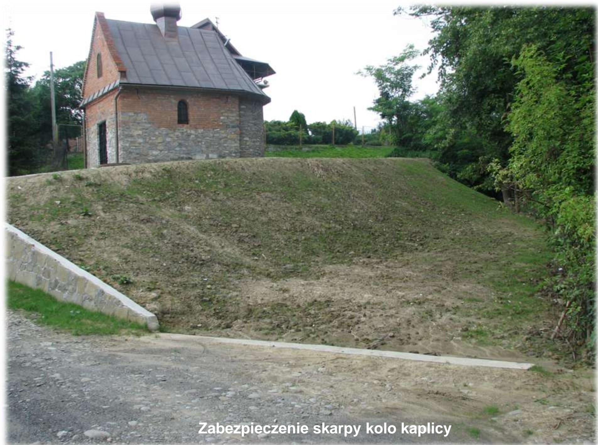
Zabezpieczenie skarpy koło kaplicy