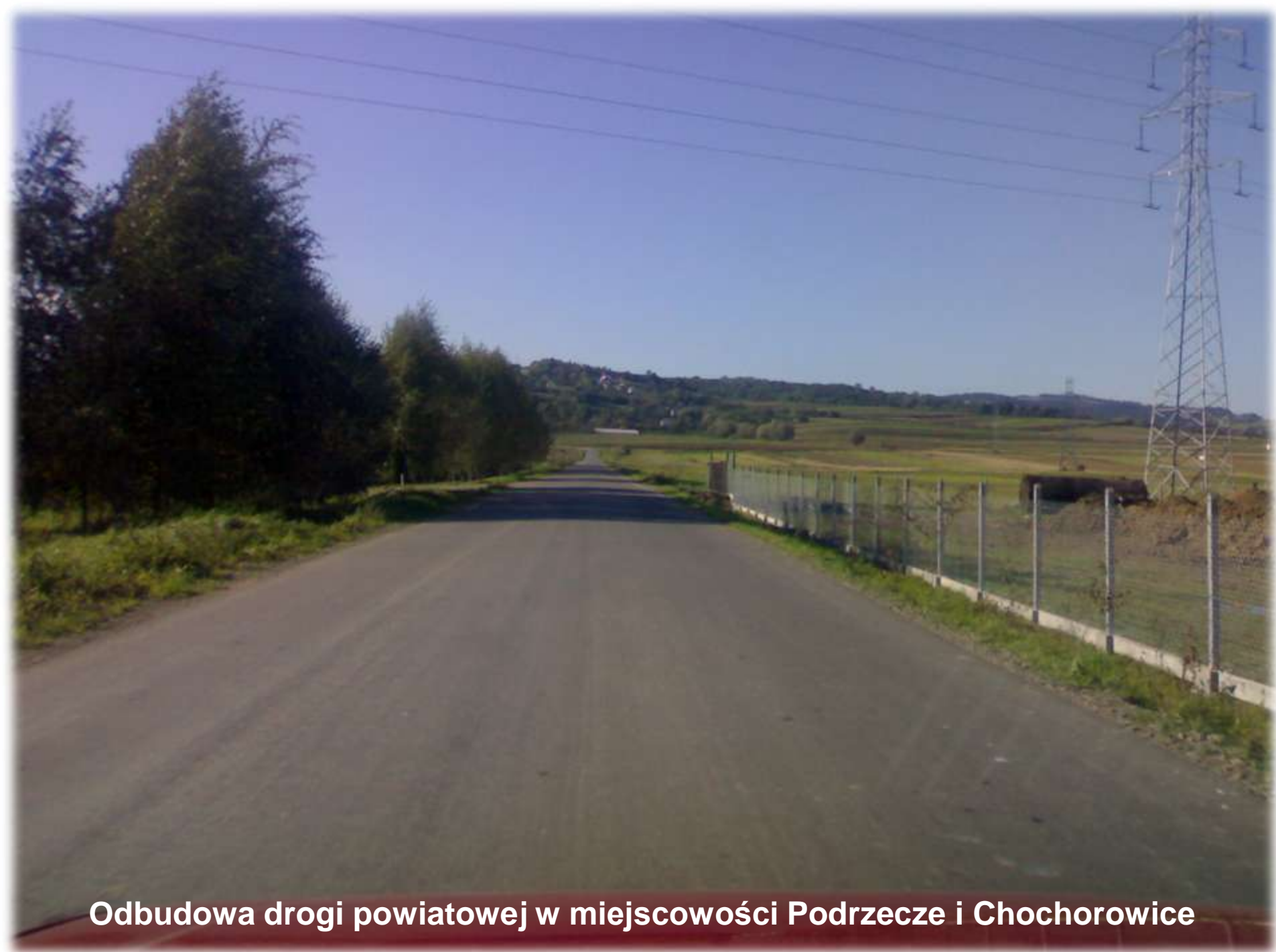
Odbudowa drogi powiatowej w miejscowości Podrzecze i Chochorowice