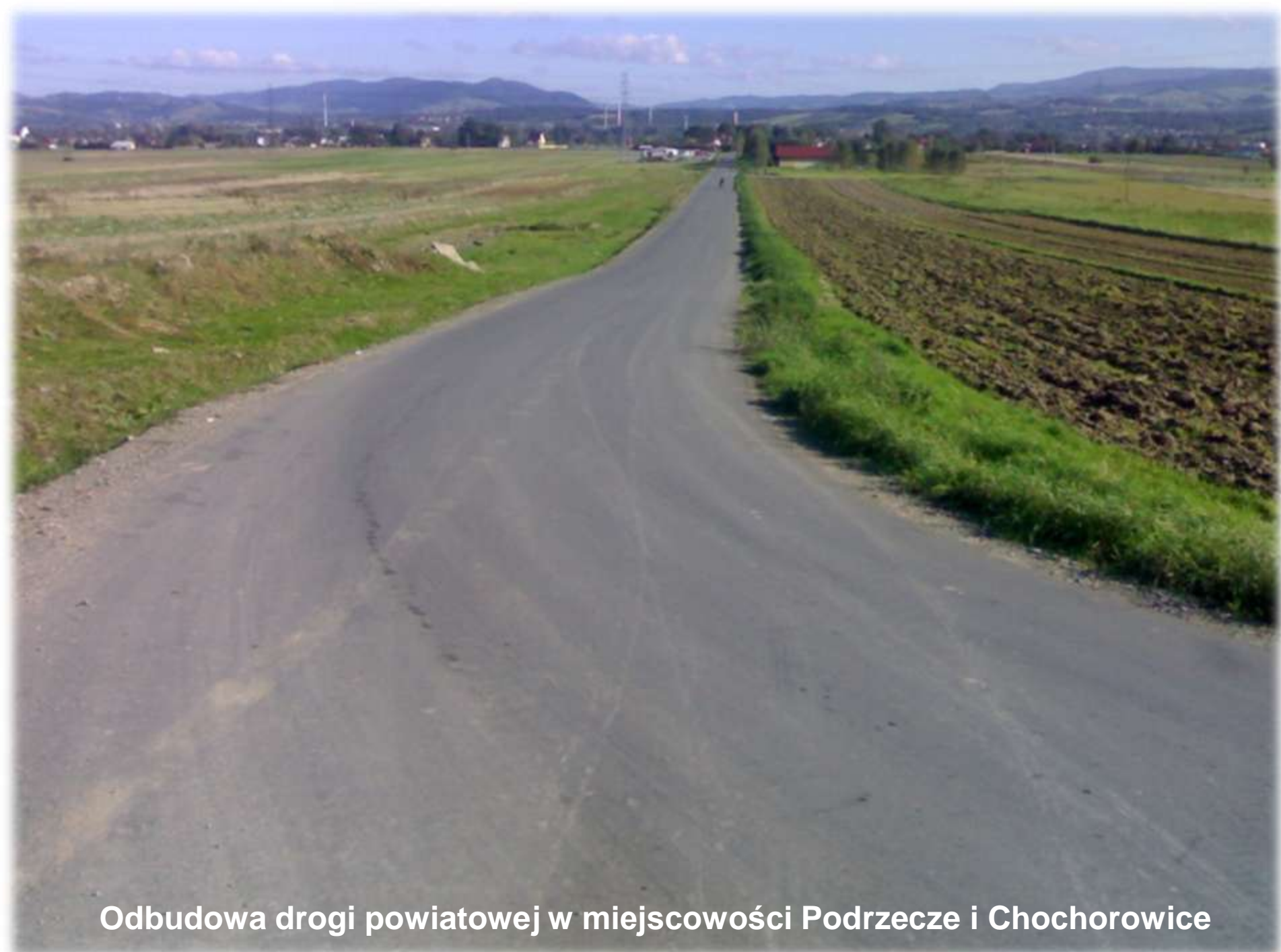
Odbudowa drogi powiatowej w miejscowości Podrzecze i Chochorowice