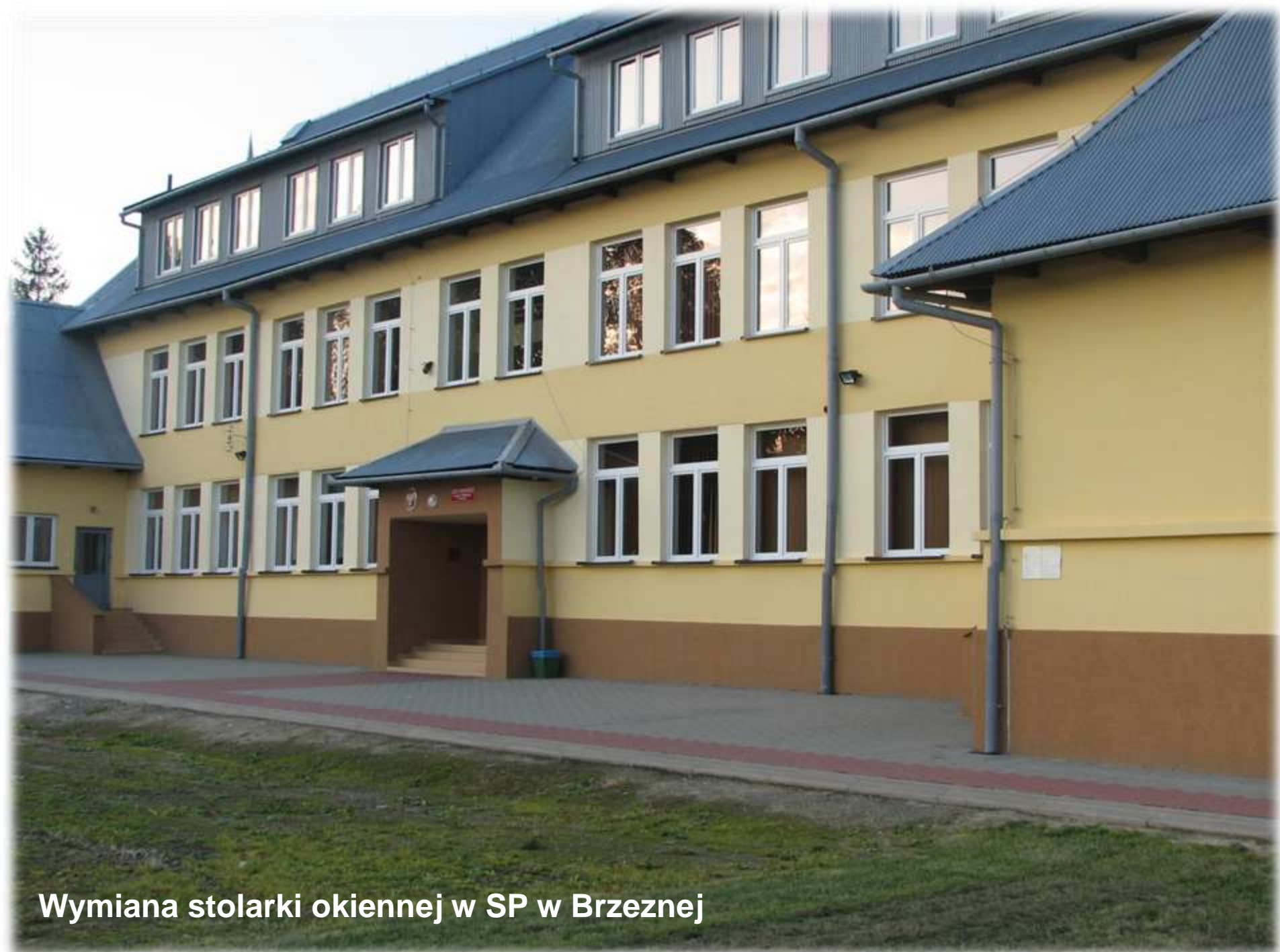
Wymiana stolarki okiennej w SP w Brzeznej