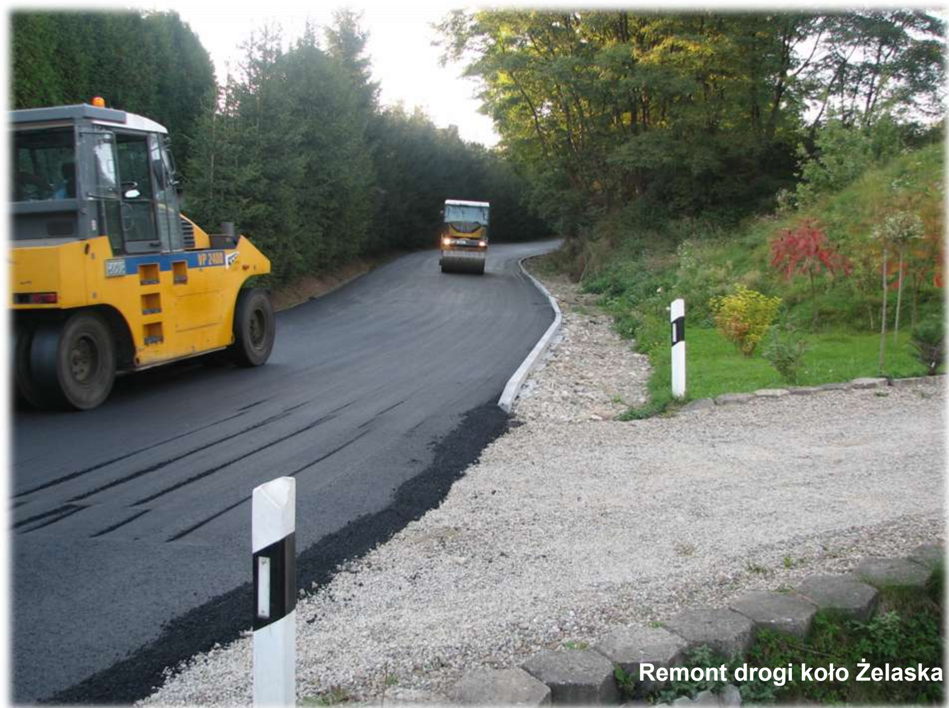
Remont drogi koło Żelaska