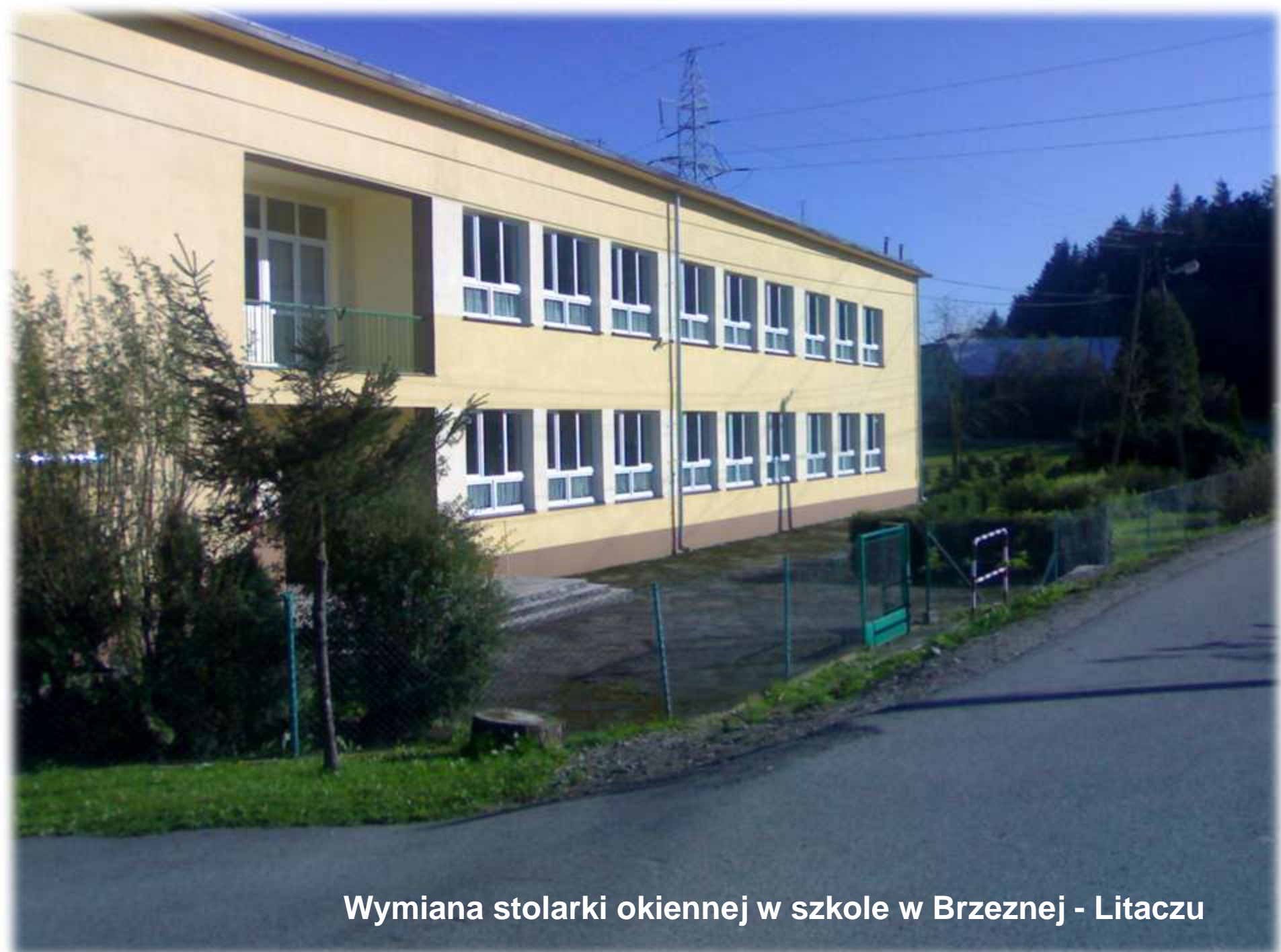
Wymiana stolarki okiennej w szkole w Brzeznej - Litaczu