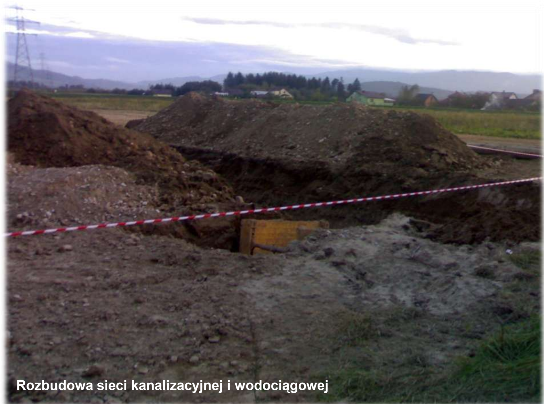
Rozbudowa sieci kanalizacyjnej i wodociągowej