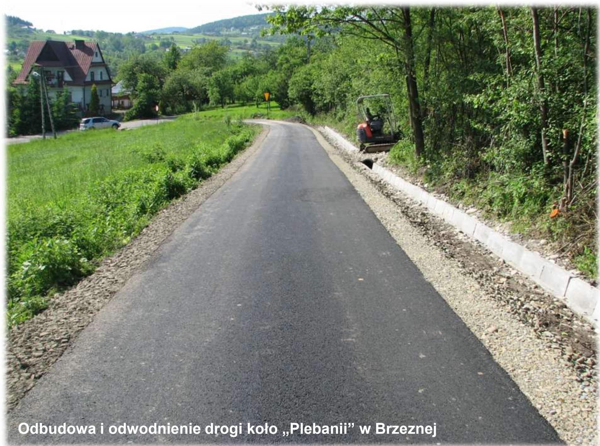
Odbudowa i odwodnienie drogi koło „Plebani” w Brzeznej