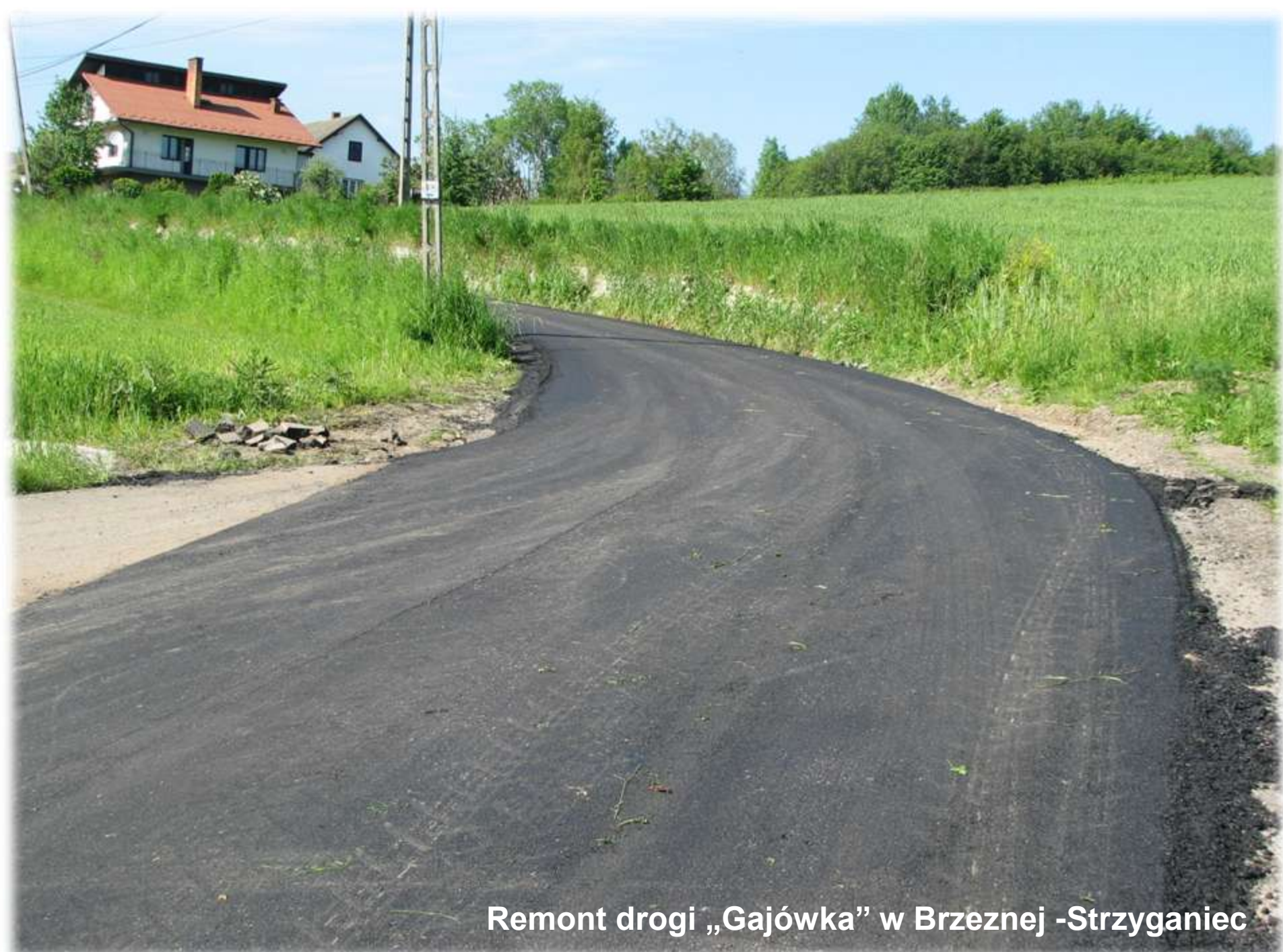
Remont drogi „Gajówka” w Brzeznej -Strzyganiec