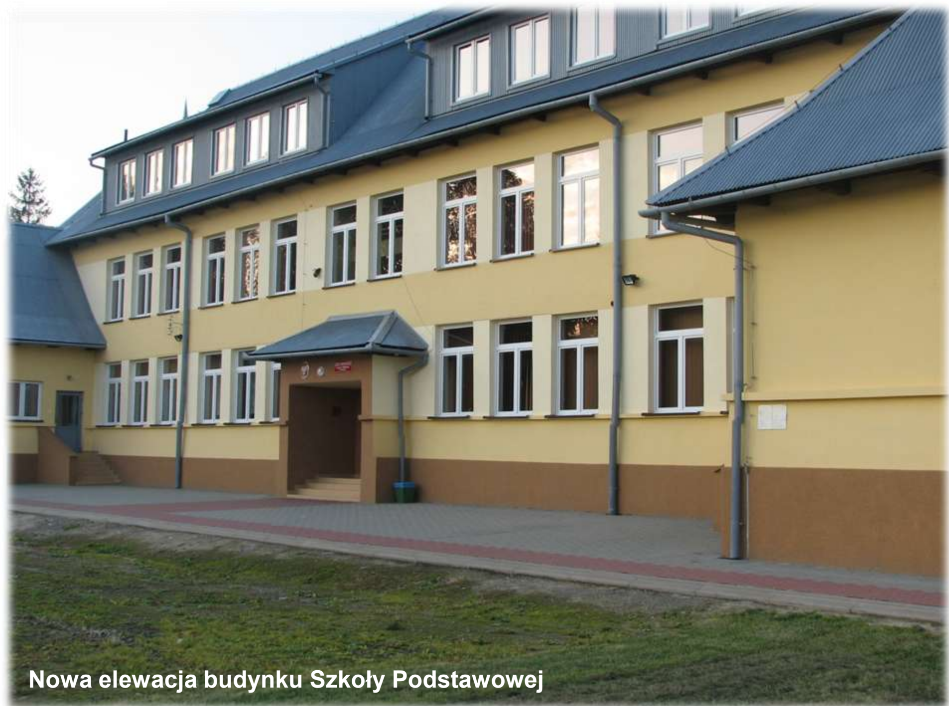
Nowa elewacja budynku Szkoły Podstawowej