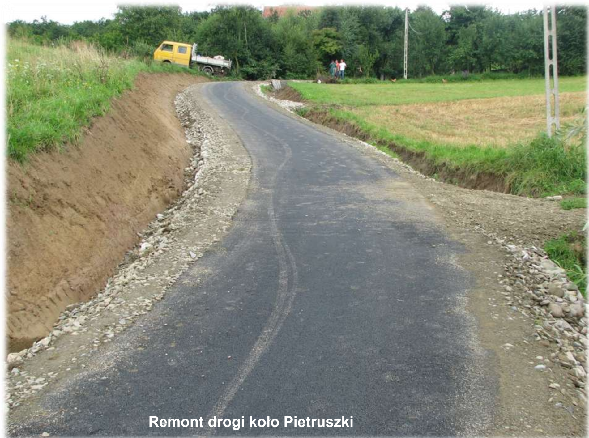
Remont drogi koło Pietruszki