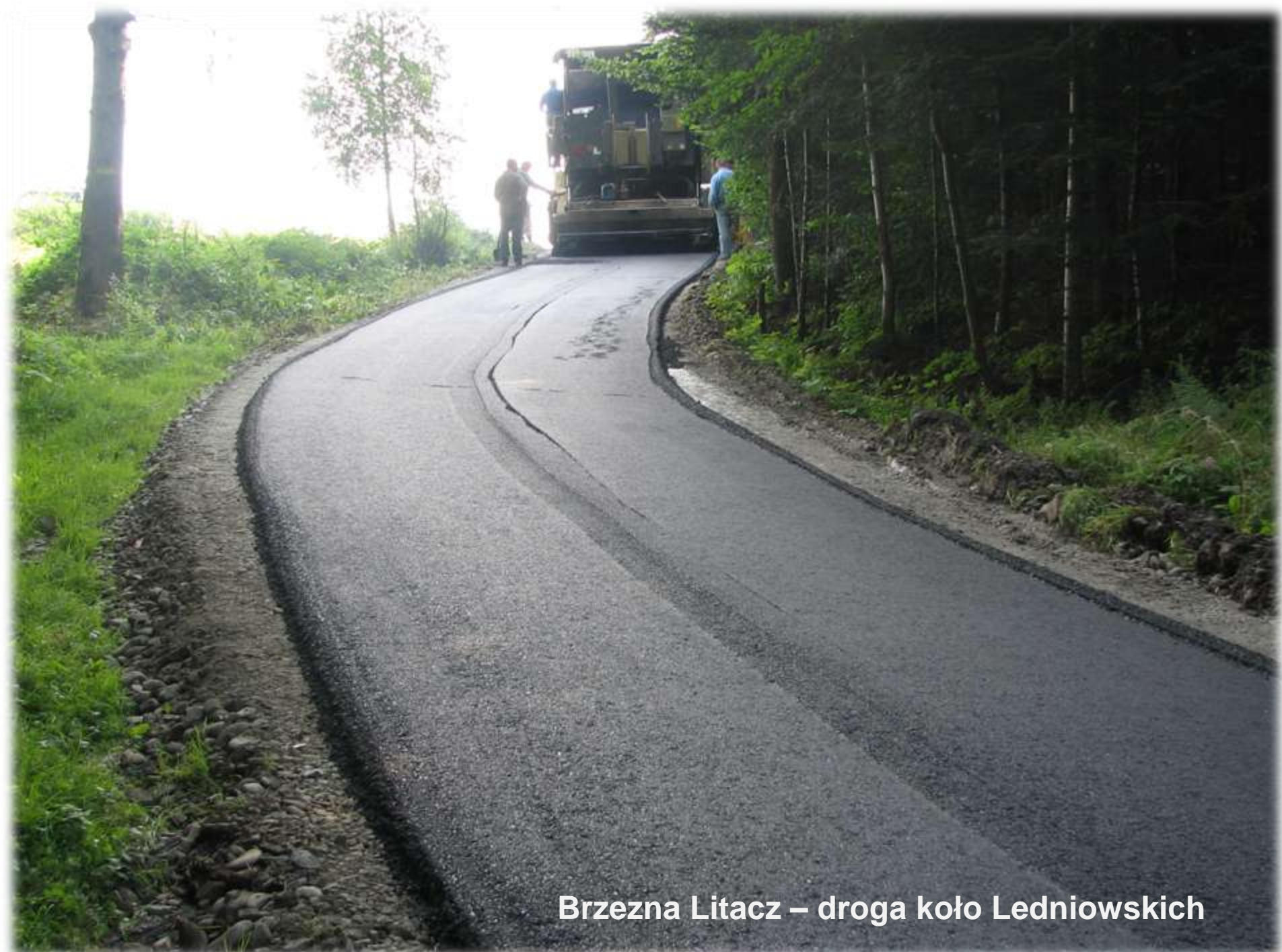
Brzezna Litacz – droga koło Ledniowskich